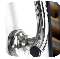
Ergonominen ja kätevä ovenkahva