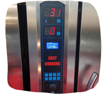
Soft Touch ohjauspaneli lisävarusteena