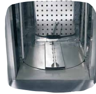
Pyörivä vaunualusta lisävarusteena