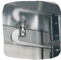
Uunissa vakiona vaunukoukku

RST siirtovaunu EN 40x60 leipomopelleille. Vaunuissa on neljä pyörää, joista kaksi on lukittavia sekä lukitustangot astioille edessä ja takana.