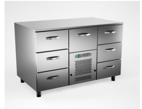
Bakeresta TSK1207 vetolaatikosto seitsemälle GN1/1 -astialle. GN-astiat ovat lisävarusteita.

Bakeresta kylmävetolaatikostot GN-astioille. Vetolaatikoissa on kevyesti liikkuvat rullateleskooppijohteet ja sisäänvedon lukitusjärjestelmä. Laatikko sulkeutuu aina ilmatiiviisti jokaiselta sivultaan kehikkoa vasten. Tehokas kylmäpuhallus jakautuu tasaisesti kaikkialle kalusteessa. Elektroninen ohjausjärjestelmä ja digitaalinen lämpötilannäyttö. Kylmäaine on R290.